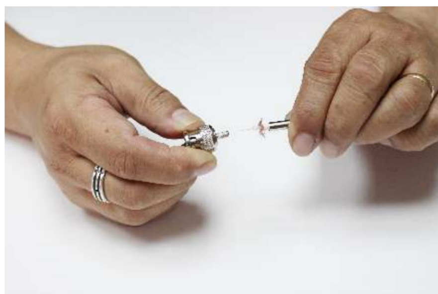
Encaixe o conector BNC.