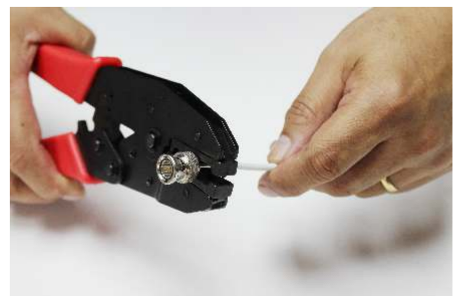
Crimp com o auxílio do alicate hexagonal.